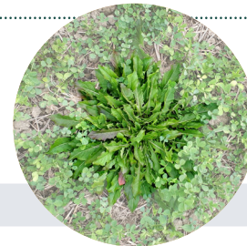
Figure 1. Pissenlit dans une prairie de 2 e année