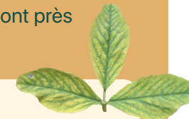
Figure 4. Chloroses internervaires associées à une carence en magnésium

Guide de référence en fertilisation, CRAAQ ▶▶▶